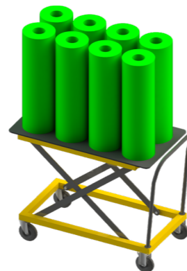
Carrito con altura ajustable

Las plataformas con soportes para las mangas, están diseñados específicamente para cada cliente, en función del diámetro interior y exterior del cliché de las mangas. El número total de bandejas que pueden ser almacenadas depende de la altura de las mangas.